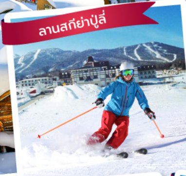
ลานสกียาปูลี่