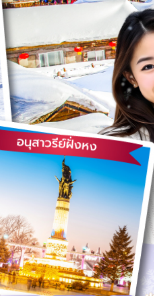
อนุสาวรีย์ผึ้งหง