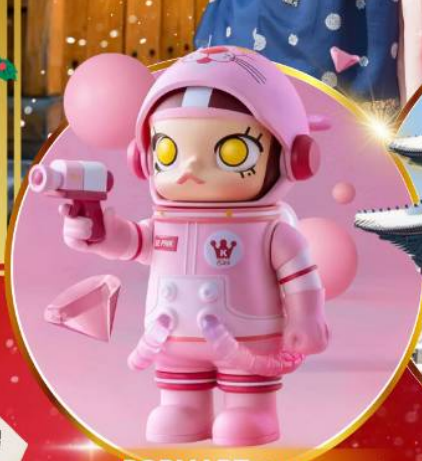
POP MART ฮงแด