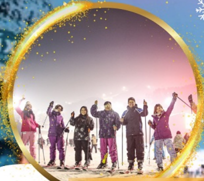
เล่นสกีสุดมันส์