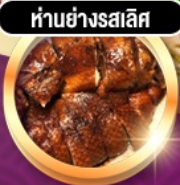
ห่านย่างรสเลิศ