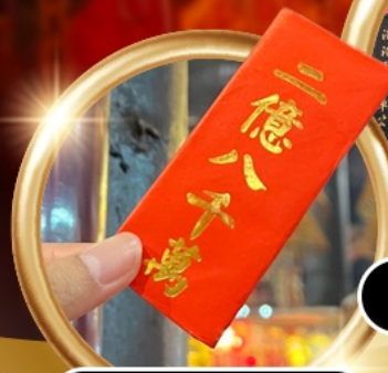
ยืมเงินเจ้าแม่กวนอิม