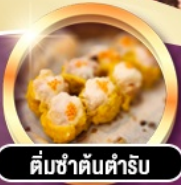
ต้มซ่าตันตำรับ