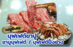
เมนูพิเศษ บุฟเฟ่ต์ข้าว ชาบูบุฟเฟ่ต์ / บุฟเฟ่ต์บิงย่าง

ราคารวมทิปไกด์แล้ว พักออนเซ็น 1 คืน พักรีดย่านช้อปปิ้ง 3 คืน