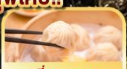
เสี่ยวหลงเปา