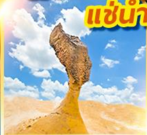
อุทยานเหย่หลิว

เที่ยวเต็ม!! 14 มิถุนายนอิสระ แช่น้ำแร่ในห้องพักส่วนตัว