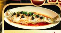
ปลาประธาราธิบดี