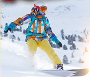
ลานสกีซิกิไซ