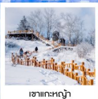
เขากระหลว้า