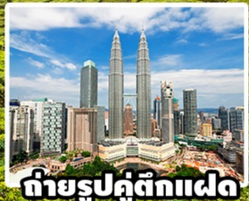
ถ่ายรูปคู่ตึกแฝด