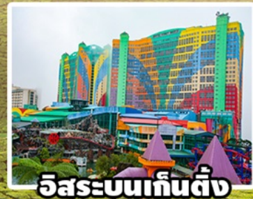
อิสระบนเก็นติ้ง