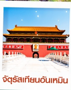
จัตุรัสเทียนอันเหมิน