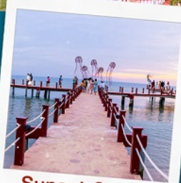
Sunset Sanato Beach Club