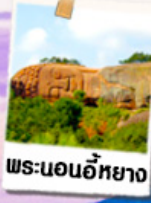
พระนอนอภัย