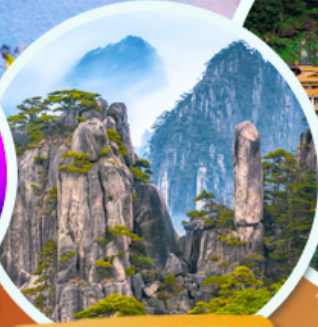
ภูเขาหวงซาน