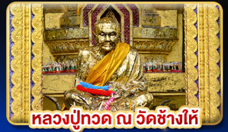
หลวงปู่ทวด ณ วัดช้างให้