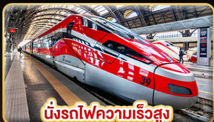
นั่งรถไฟความเร็วสูง ฟลอเรนซ์ - นาโปลี