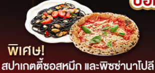
พิเศษ! สปาเกตตี้ซอสหมัก และ-พิซซ่านาโปลี