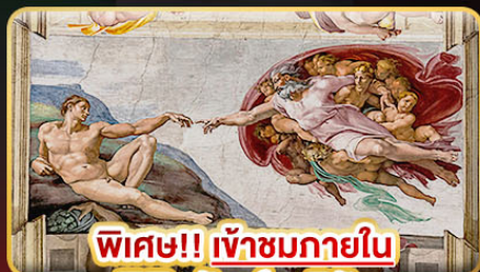
พิเศษ!! เข้าชมภายใน พิพิธภัณฑ์วาติกัน