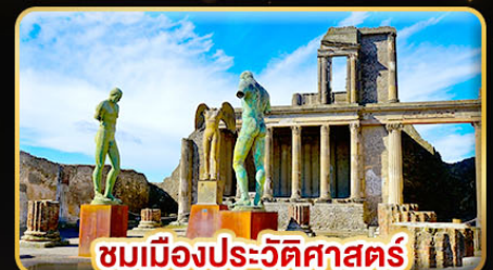
ชมเมืองประวัติศาสตร์ ปอมเปอี