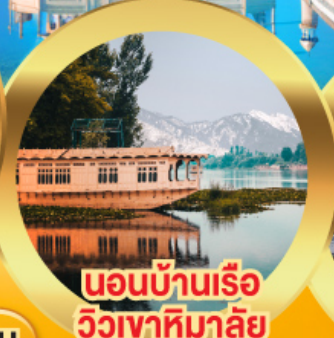
นอนบ้านเรือ วิวเขาหิมาลัย