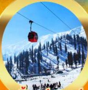
เคเบิลคาร์ กุลมาร์ค