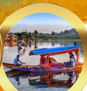
ล่องเรือซิคาร์่า