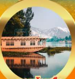
นอนบ้านเรือ วิวเขาหิมาลัย