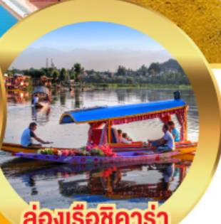
ล่องเรือซิคาร์่า