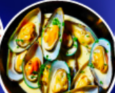
หอยแมลงภู่ออนันท์