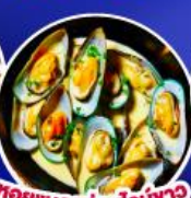
หอยแมลงภู่อบไวน์ขาว