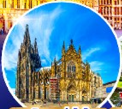
มหาวิหารแห่งโคโลญ