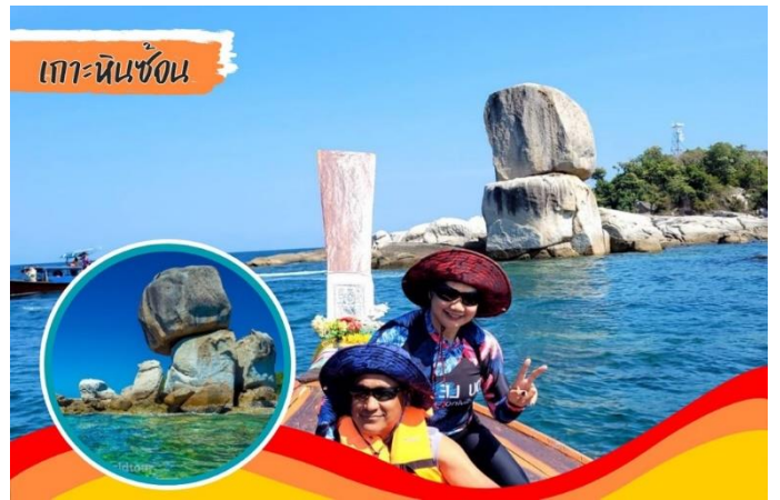
เกาะหินซ้อน

ของกรุ๊ป) เดินทางสู่ เกาะหินซ้อน ที่ธรรมชาติสร้างสรรค์ได้อย่างน่าอัศจรรย์ อิสระให้ท่านถ่ายกับประติมากรรมทางธรรมชาติ ก่อนนำท่านเดินทางต่อสู่ เกาะรอกลอย เกาะที่ได้ชื่อว่ามีน้ำทะเลที่ใสหาดทรายขาวละเอียดและสวยงามที่สุด เกาะหนึ่งใน..เหมาะแก่การเล่นน้ำถ่ายรูป หรือเดินขึ้นเขา..ชมวิวเป็นอย่างมาก