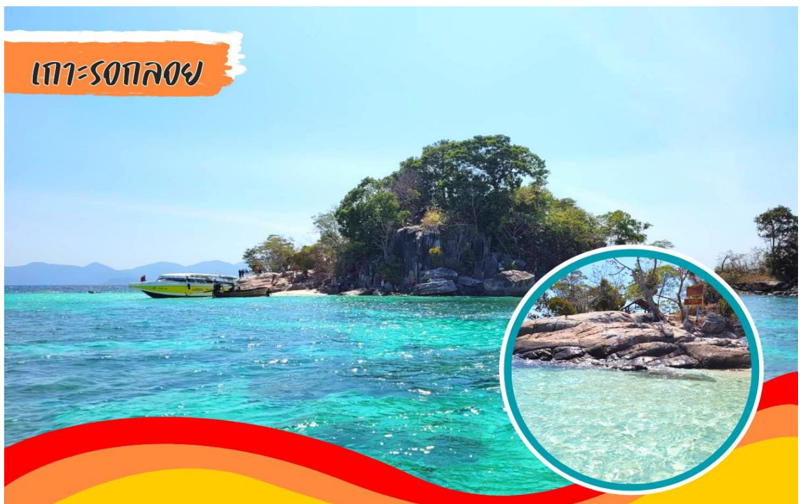
เกาะรอกลอย