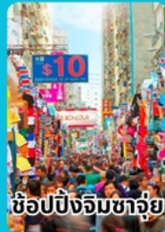
ช้อปปิ้งจิมซาฉุย