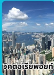
วิวคตอเรียพอยท์