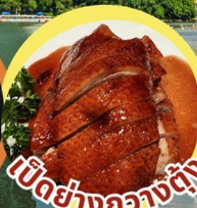
เป็ดย่างกวางตุ้ง