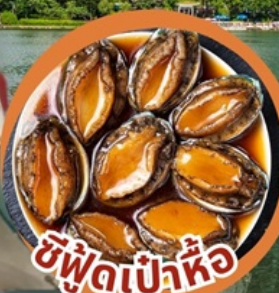
ซีฟู้ดเป่าหื้อ