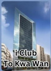
i Club To Kwa Wan