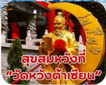
สุขสมหวังที่ "วัดหวังต้าเซียน"

แพ็คเกจทัวร์ฮ่องกง 3 วัน 2 คืน ที่คุ้มค่าที่สุดเ็นสามโลก