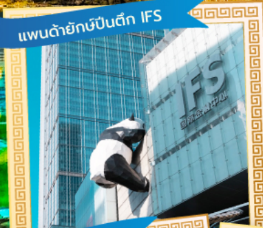
แพนด้ายักษ์ปิ่นตึก IFS