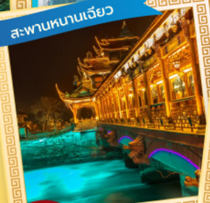
สะพานหนานเฉียว