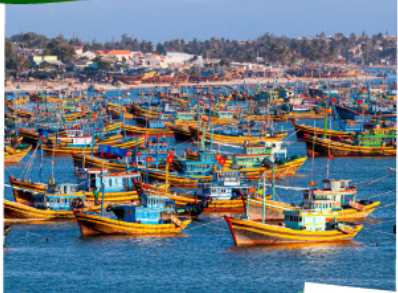
หมู่บ้านชาวประมงมุยเน่