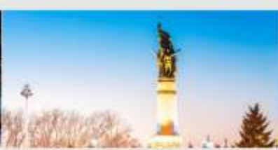
อนุสาวรีย์ผึ้งหง