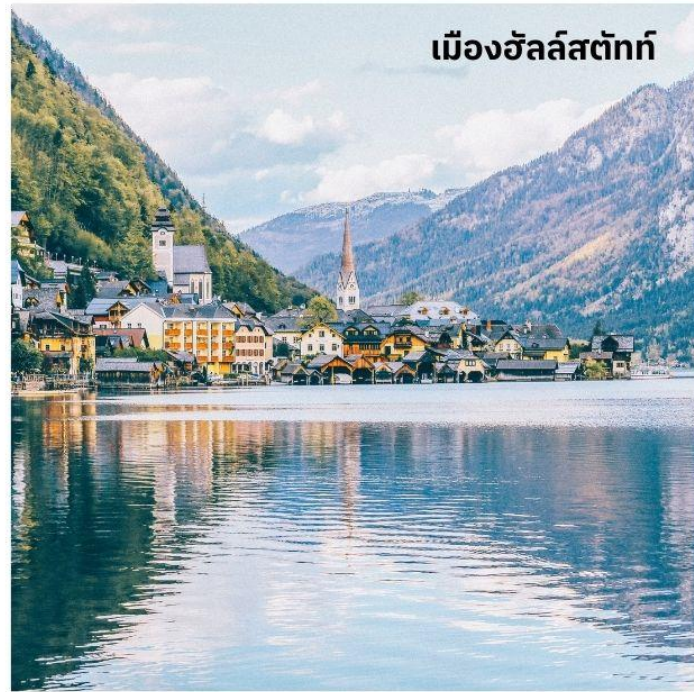
เมืองฮัลล์สตัดท์