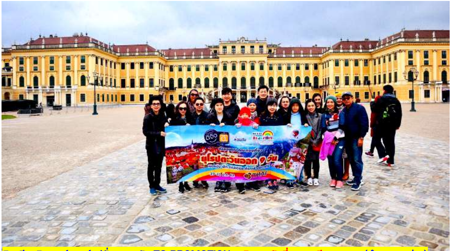
อิตาลี-สวิสเซอร์แลนด์-ฝรั่งเศส 9 วัน TG PROMOTION4 เดินทางวันที่ 2-10 มี.ค. 2562 (จำนวน 20 ท่าน)