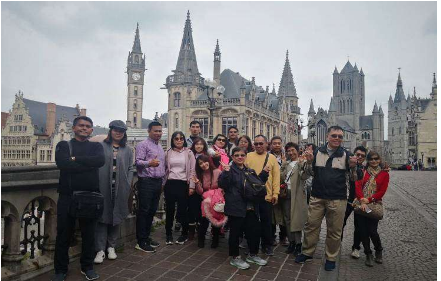
ยุโรปคอนฮอฟ(งานดอกไม้โลก)เยอรมัน เนเธอร์แลนด์ เบลเยียม สภทราด10-17เม.ย.2562 (จำนวน33ท่าน)