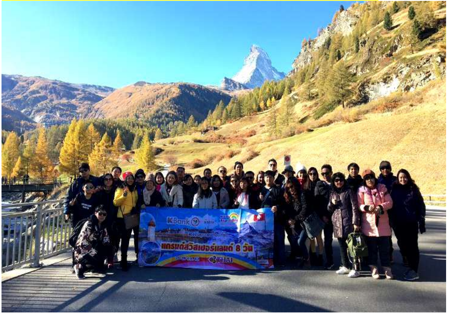
อิตาลี-สวิสเซอร์แลนด์-ฝรั่งเศส 9 วัน TG PROMOTION 4 ช่วงหยุดปี: 20-28 ต.ค. 2561 (จำนวน 40 ท่าน)