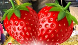
มีผลตอบเอบอจ้สุด ๆ จากรั้