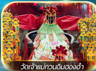
วัดเจ้าแม่ทวนอิมฮ่องกง