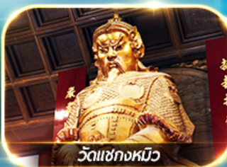
วัดเซ็กกงหมิว