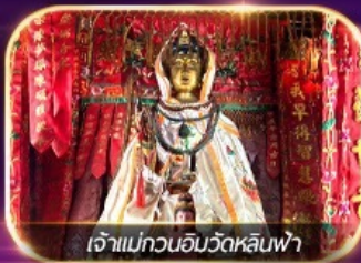
เจ้าแม่กวนอิมวัดหลินฟา

เต็มอิ่มทั้งบุญ และ ซ้อมปิ้งแบบจัดเต็ม จิมซาจุ่ย มงก๊ก