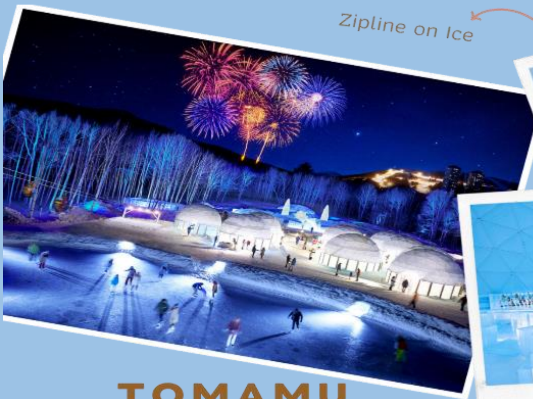
Zipline on Ice

จากนั้นนำท่านเดินทางสู่ TOMAMU ICE VILLAGE ซึ่งตั้งอยู่ใน โฮชิโนะรีสอร์ทโทมามุ (Hoshino Resort Tomamu) เป็นหมู่บ้านชั่วคราวที่สร้างขึ้นจากการแกะสลักน้ำแข็งในช่วงฤดูหนาวเท่านั้น บ้านน้ำแข็งแต่ละหลังมีการประดับประดาแสงไฟสีสันต่าง ๆ ให้งดงามมากยิ่งขึ้น นอกจากนี้ให้การเก็บภาพความสวยงามของบ้านน้ำแข็งแล้วยังมีกิจกรรมอื่น ๆ อีกมากมาย เช่น Zipline on Ice จะเคลื่อนตัวลงมาเป็นระยะทางประมาณ 60 เมตร ระหว่างทางคุณจะได้ชื่นชมทิวทัศน์ของหิมะ และลานน้ำแข็งที่น่าอัศจรรย์ Ice Bakery & Cafe คาเฟ่ที่ให้บริการเครื่องดื่มร้อน และขนม ที่ให้ท่านนั่งทานบนโต๊ะและเก้าอี้น้ำแข็ง Ice Bar บาร์ที่บริการเครื่องดื่มประเภทค็อกเทล และเครื่องดื่มแอลกอฮอล์อื่น ๆ หลายชนิด ที่เสิร์ฟในแก้วน้ำแข็งสวย ๆ เป็นต้น (**ราคาทัวร์ไม่รวมค่ากิจกรรม และค่าเครื่องดื่ม Ice Bar, Ice Bakery&Cafe**) จากนั้นนำท่านเดินทางกลับสู่เมืองซัปโปโร