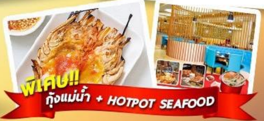
พิเศษ!! กุ้งแม่น้ำ + HOTPOT SEAFOOD