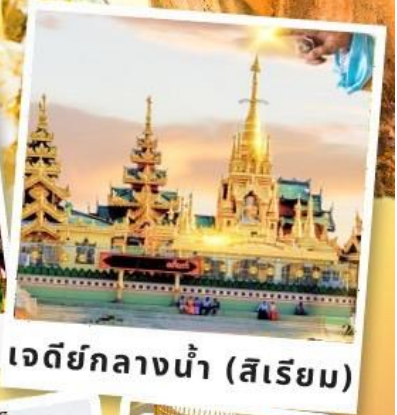
เจดีย์กลางน้ำ (สิริเยม)