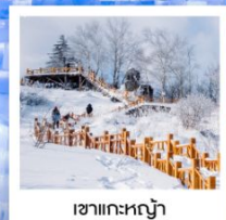
เขากระหลว้า