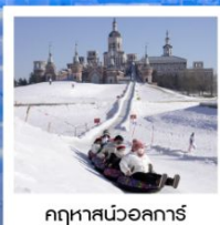
ฤดูหาวสนวอลการ