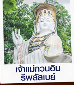
เจ้าแม่กวนอิม ริ้วลีสเบย์