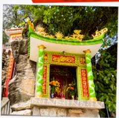
ศาลเจ้าติงซา