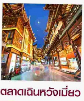
ตลาดเดินหัวงเมี่ยว