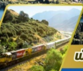
นั่งรถไฟทรานซ์ อัลไพน์