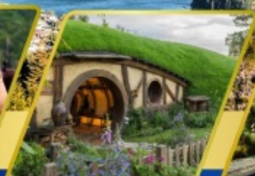
บ้านฮอบบิต