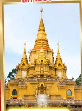
วัดพุทธาธิวาส