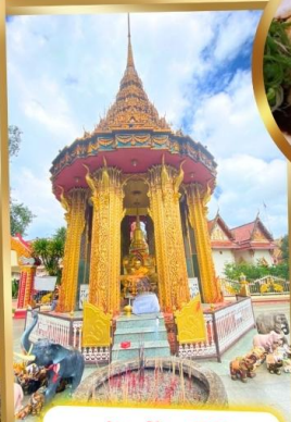
วัดช้างไห้