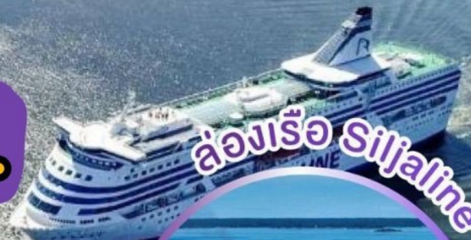
ล่องเรือ Siljaline