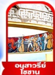
อนุสาวรีย์ โซซาน