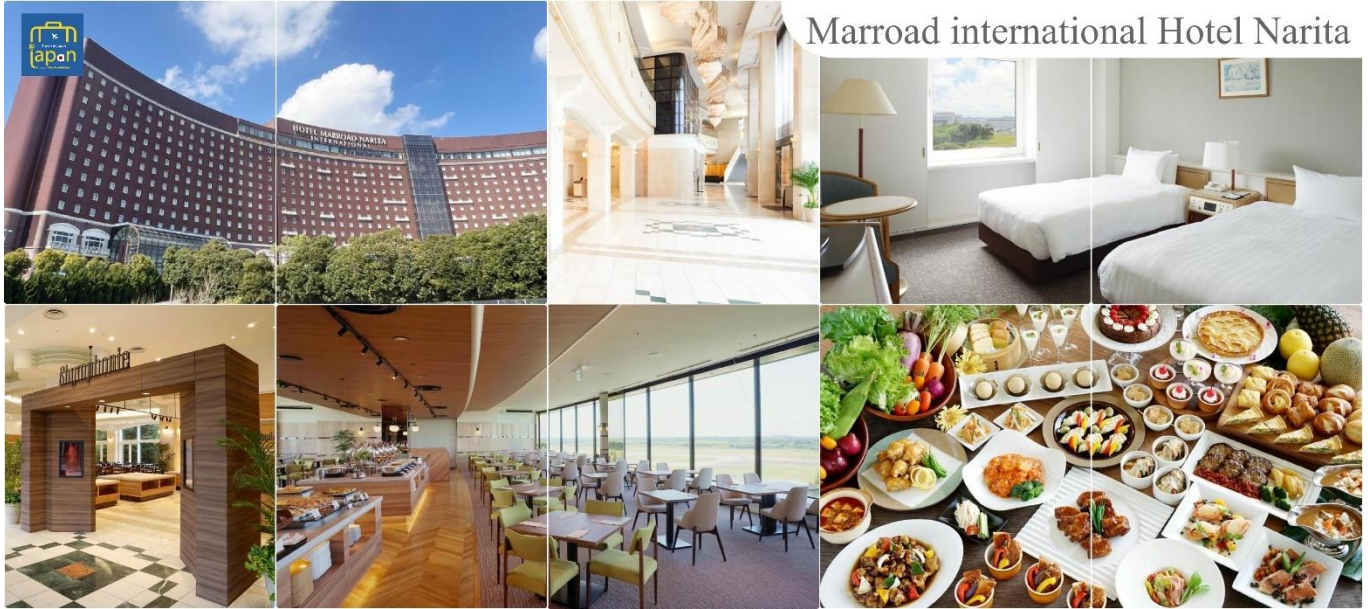
Marroad international Hotel Narita

MARROAD INTERNATIONAL HOTEL NARITA หรือเทียบเท่าระดับเดียวกัน