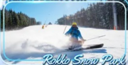
Rokko Snow Park