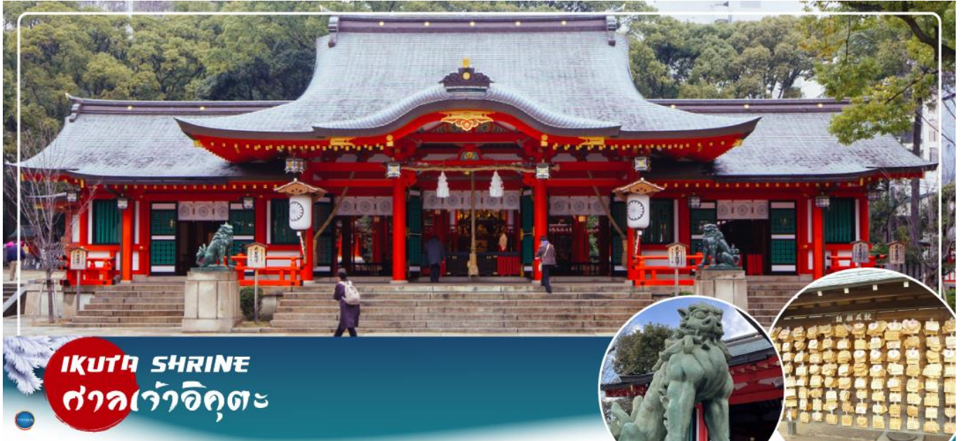
IKUTA SHRINE ศาลเจ้าอิคุตะ

จากนั้นนำท่านสักการะ ศาลเจ้าอิคุตะ (Ikuta Shrine) ตั้งอยู่ในย่านใจกลางเมืองชั้นโนะมิยะ (Sannomiya) เป็นศาลเจ้าที่มีประวัติศาสตร์ยาวนาน ก่อตั้งในปี 201 หนึ่งในสามศาลเจ้าหลักของ โกเบที่มีประวัติศาสตร์ยาวนานกว่า 1,800 ปี ทางเหนือไปตามถนนช็องนินอิคุตะ คุณจะเห็นทางเข้า ศาลเจ้าพร้อมประตูโทริอิที่สร้างโดยใช้วัสดุรีไซเคิลจากศาลเจ้าใหญ่อิเสะ ศาลเจ้าอิคุตะมีชื่อเสียงในด้านผลประโยชน์ในการจับคู่ เนื่องจากจิตอาฮา อนุชนเป็นเทพเจ้าผู้ทอเสื้อผ้าของเทพเจ้า และเธอ ทอผ้าและด้ายเข้าด้วยกัน คนในพื้นที่เรียกกันอย่างเสนาหว่า "อิคุตะซัง"