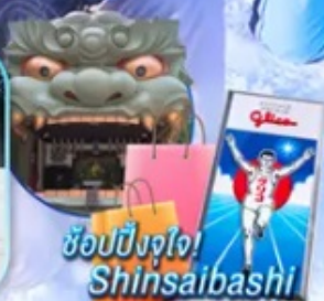
ช้อปปิ้งจุใจ! Shinsaibashi