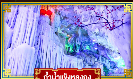
ถ้ำน้ำแข็งหลงกง

สุดอลังการ น้ำตก 2 พรมแดน แหล่งท่องเที่ยวระดับ 5A