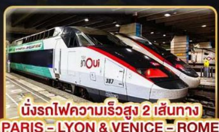
นั่งรถไฟความเร็วสูง 2 เส้นทาง PARIS - LYON & VENICE - ROME

📅 เดินทาง : 11-20 ก.พ. 68 / 15-24 มี.ค. 68 05-14 เม.ย. 68 / 29-08 พ.ค. 68