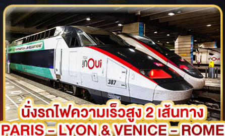
นั่งรถไฟความเร็วสูง 2 เส้นทาง PARIS - LYON & VENICE - ROME

✈️ เดินทาง : 11-20 ก.พ. 68 / 15-24 มี.ค. 68 05-14 เม.ย. 68 / 29-08 พ.ค. 68