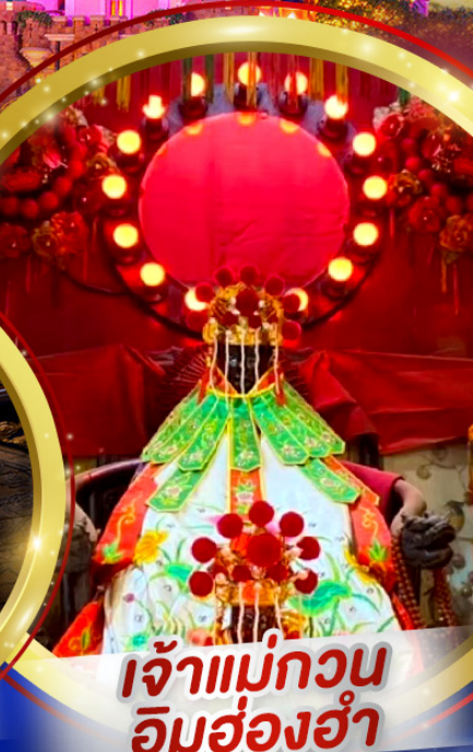
เจ้าแม่กวนอิมสองอ้า