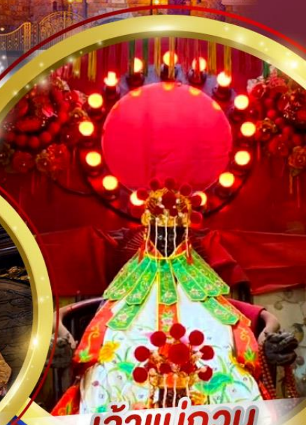
เจ้าแม่กวนอิมฮ่องฮำ