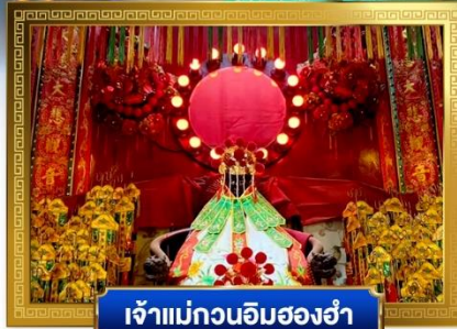
เจ้าแม่กวนอิมสองห้า