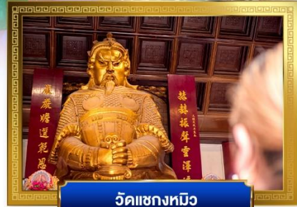
วัดแซงทมิว