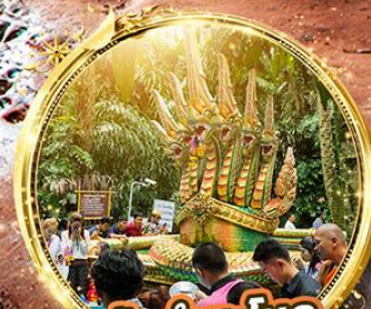
ปากำชะโนด