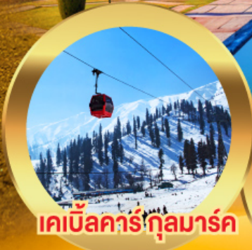
เคเบิลคาร์กุลมาร์ค