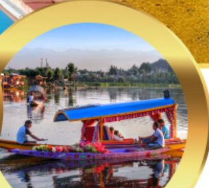
ล่องเรือซิคาร์่า