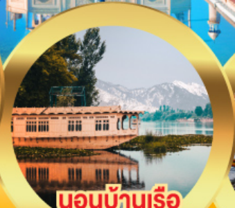
นอนบ้านเรือ วิวเขาหิมาลัย