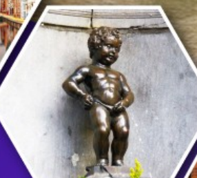
แมนเกินฟิส