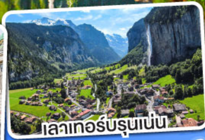
เลาเกอร์บรุนเนน