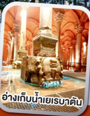
อ่างเก็บน้ำเยเรบาตัน