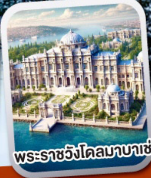
พระราชวังโดลมาบาเช่