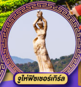
จูไห่พิงเซอร์เกิร์ล